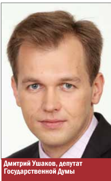
Дмитрий Ушаков, депутат Государственной Думы

и другими чиновниками понадобились для того, чтобы убедить их провести совещание, на котором были бы обсуждены проблемные зоны строительства моста над Морским каналом. Его высота – 54 метра – лишает возможности входа в Неву целый ряд кораблей. Например, известные на весь мир парусники «Крузенштерн» и «Седов» – высота их мачт более 60 метров. Атомный ледокол, строящийся на Балтийском заводе, не сможет выйти в Морской канал – высота его мачт 64 метра. «Мистрали», которые