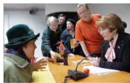
Фотография из книги Оксаны Дмитриевой. Встреча с избирателями

созывов, доктора экономических наук, профессора. Книга об исторической неизбежности и роли личности в истории, о настоящих политиках и бизнесменах от политики, о публичных сражениях и подкованных битвах, о героизме и трусости, о верности и предательстве. ■