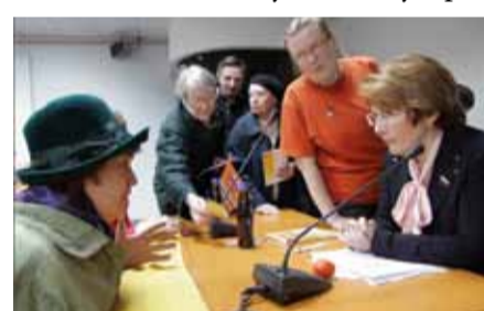
Фотография из книги Оксаны Дмитриевой. Встреча с избирателями

созывов, доктора экономических наук, профессора. Книга об исторической неизбежности и роли личности в истории, о настоящих политиках и бизнесменах от политики, о публичных сражениях и подкованных битвах, о героизме и трусости, о верности и предательстве. ■