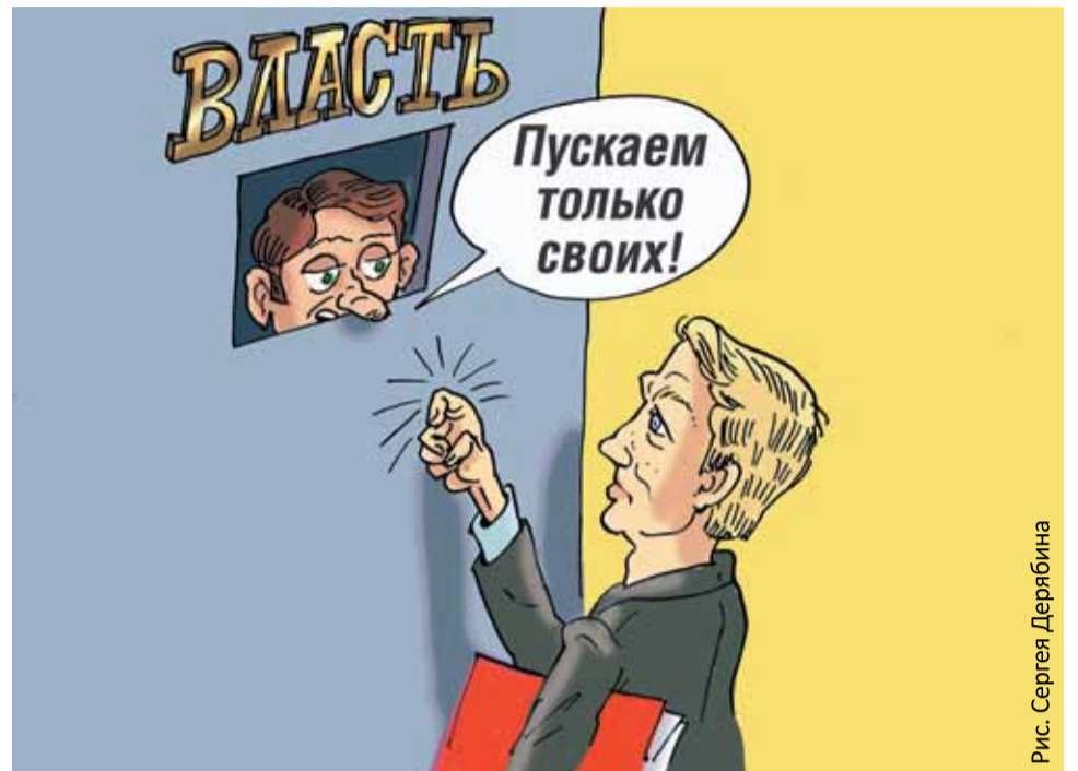
Рис. Сергея Дерябина

На Конференции СПРАВЕДЛИВАЯ РОССИЯ выдвинула на муниципальные выборы 918 кандидатов. Только 628 представителей Партии сумели пробиться в комиссии и сдать документы. Из них зарегистрировано 484 кандидата, 144 получили отказ. «Гражданская платформа» выдвинула 233 кандидата, зарегистрировано 96, отказов – 127. Очевидно, что кандидаты в муниципальные депутаты от СПРАВЕДЛИВОЙ РОССИИ, «Гражданской платформы» и «Яблока», незави-