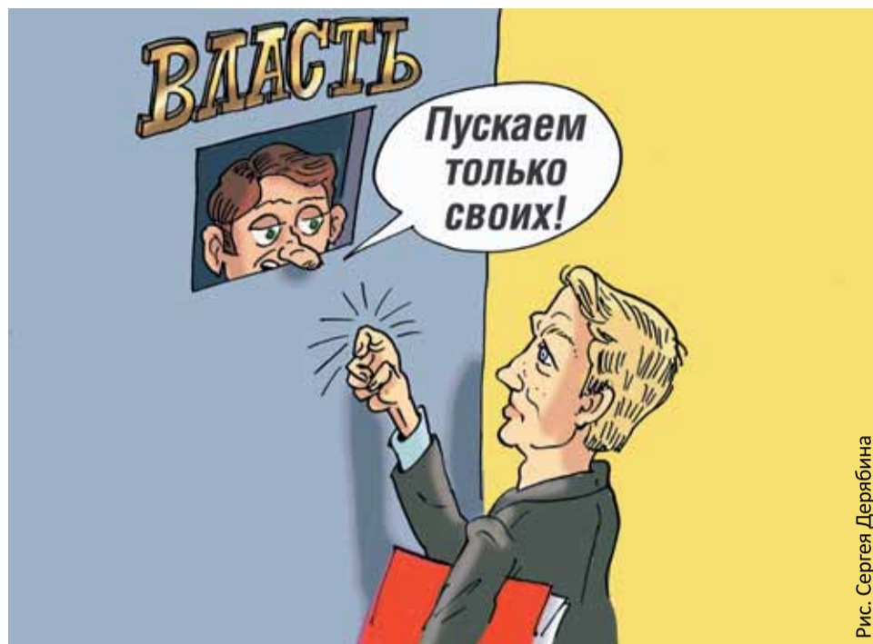
Рис. Сергея Дерябина

На Конференции СПРАВЕДЛИВАЯ РОССИЯ выдвинула на муниципальные выборы 918 кандидатов. Только 628 представителей Партии сумели пробиться в комиссии и сдать документы. Из них зарегистрировано 484 кандидата, 144 получили отказ. «Гражданская платформа» выдвинула 233 кандидата, зарегистрировано 96, отказов – 127. Очевидно, что кандидаты в муниципальные депутаты от СПРАВЕДЛИВОЙ РОССИИ, «Гражданской платформы» и «Яблока», незави-