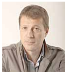
Лидер фракции СПРАВЕДЛИВАЯ РОССИЯ в Законодательном собрании СПб

С февраля этого года в Петербурге вступил в силу закон о капремонте. Работы финансируются из двух источников: бюджетные средства и ежемесячные взносы граждан на будущий ремонт своего жилья в фонд капремонта либо на специальный счет, открытый ТСЖ.