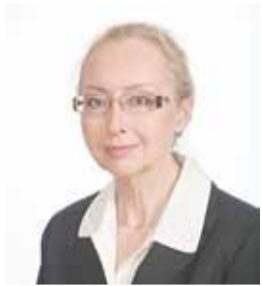
Депутат Государственной Думы К.Э.Н.

Пустых полок не будет. Однако продукцией какого качества и по какой цене они будут заполнены – это вопрос. Введение запрета на ввоз продовольствия из стран ЕС и США может быть использовано как рычаг развития отечественного сельскохозяйственного производства. Но для этого нужны энергичные и грамотные действия как федеральных, так и петербургских властей, чего я пока не наблюдаю. Что делать? Срочно составить балансы производства и потребления по каждой товарной группе. Нужно определить, в каком объеме и как можно импорт заместить отечественной продукцией. Следует срочно заключать договора и организовывать прямые поставки из аграрных регионов в Петербург. Надо провести инвентаризацию складских и холодильных мощностей. Надо срочно восстанавливать загубленный малый розничный и оптовый бизнес, разгромленные объекты нестационарной торговли, рынки, ярмарки. Если этого не будет сделано, то самотеком розничные сети заполнят полки низкокачественной импортной продукцией, китайской, африканской, по более высокой цене. Бездействие городских властей, паралич их ума и воли может дорого обойтись петербуржцам.