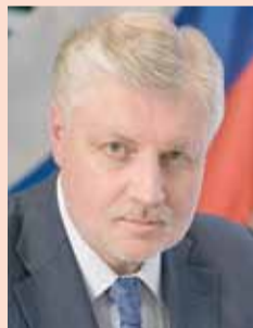
Сергей Миронов, председатель Политической партии СПРАВЕДЛИВАЯ РОССИЯ

Поверьте – те кандидаты от оппозиции, которые прошли этап регистрации и смогли преодолеть и победить сейчас, будут эффективно и честно работать для жителей муниципального образования!