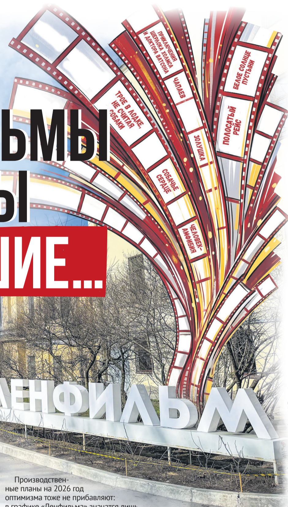
Фото: Дмитрий Вертков, коллаж: Алексей Беленёв

Безусловно, обновлять материальную базу нужно! Однако настораживает опыт: у Смольного набита рука на штамповке однотипных культурных пространств. Петербуржцы уже не раз наблюдали, как вместо творческих цехов и студий появляются очередные хипстерские кластеры с бесконечными ресторанами, лавками и сомнительными интерьерами. Не постигнет ли легенду кинематографа участь стать бизнес-центром с фудкортом?