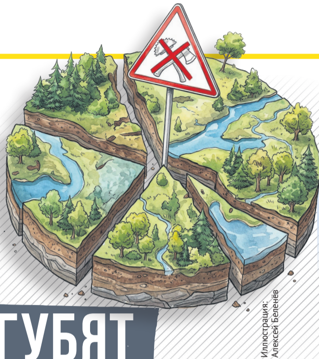
Иллюстрация: Алексей Беленёв

Разрешить в ООПТ строительство любых объектов государственного значения и позволить по щелчку пальцев менять границы нацпарков – вот чего добиваются авторы поправок.