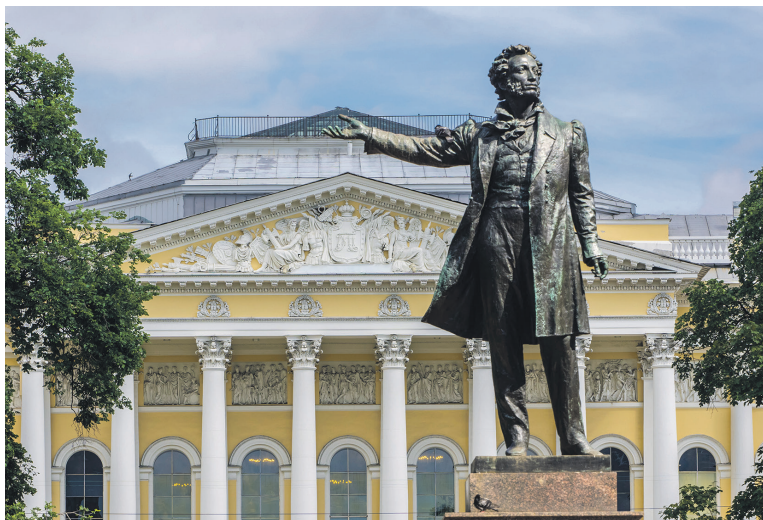
«Русский музей» был вынужден отказаться от реализации плана по реконструкции Михайловского замка.