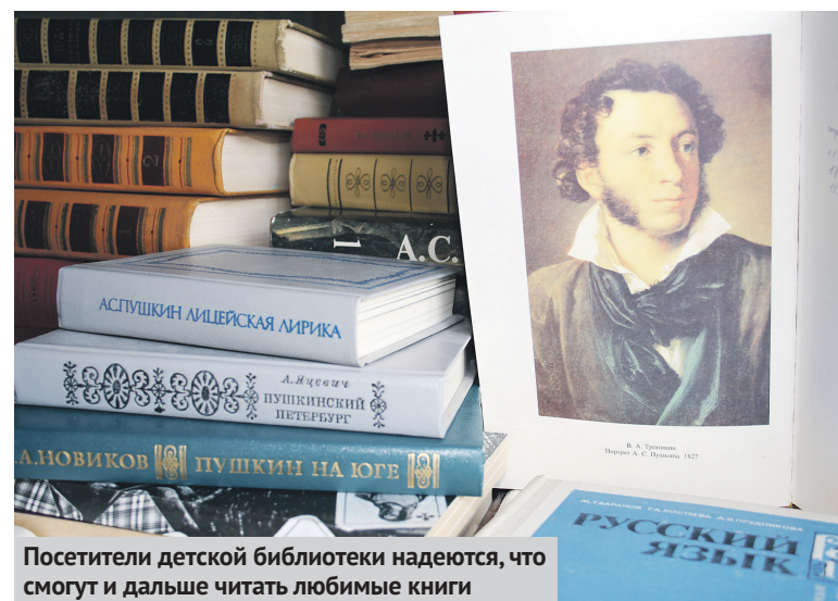
Посетители детской библиотеки надеются, что смогут и дальше читать любимые книги

Парламентарий попросил губернатора дать соответствующие указания, чтобы возобновить работу службы. По итогам встречи Георгий Полтавченко пообещал отреагировать на озвученные Олегом Ниловым проблемы.