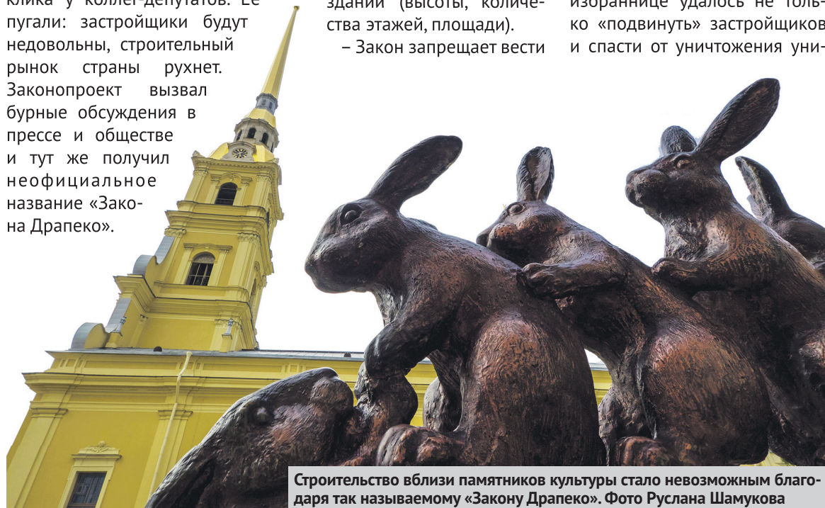
Строительство вблизи памятников культуры стало невозможным благодаря так называемому «Закону Драпеко».

Государственную Думу, однако инициатива не вызвала отклика у коллег-депутатов. Ее пугали: застройщики будут недовольны, строительный рынок страны рухнет. Законопроект вызвал бурные обсуждения в прессе и обществе и тут же получил неофициальное название «Закон Драпеко».