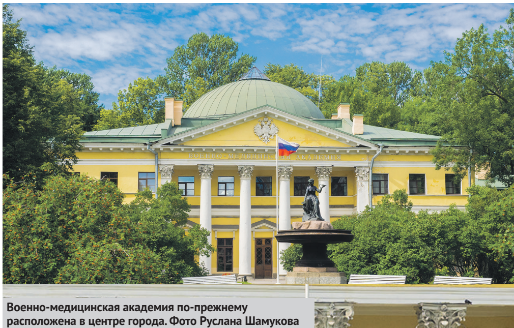
Военно-медицинская академия по-прежнему расположена в центре города.

Инициативу эсеров поддержали депутаты остальных фракций: протест по поводу перевода ВМА был направлен и главе государства.