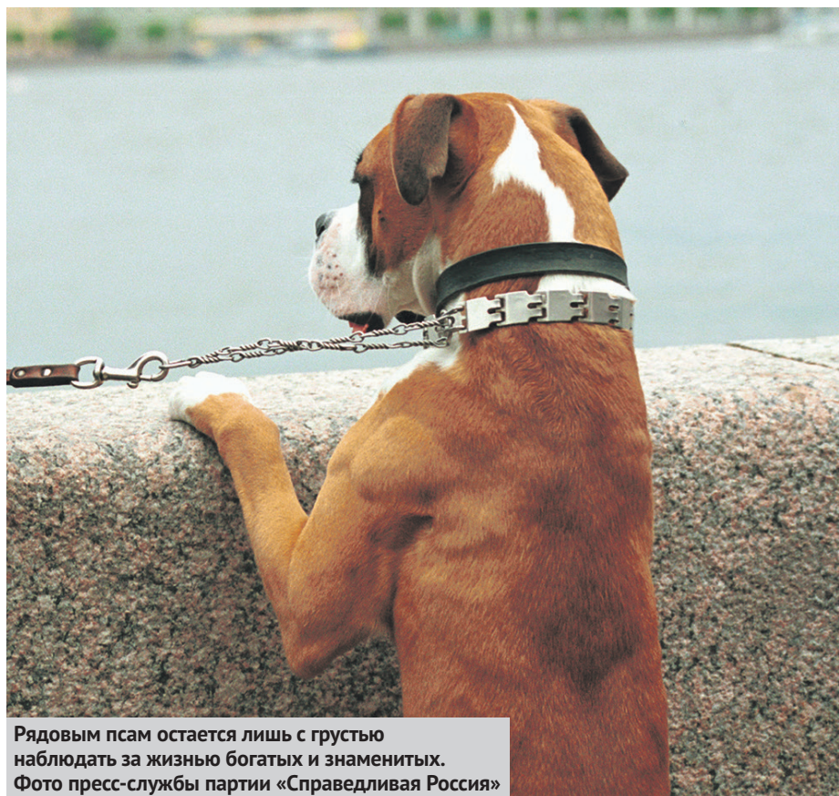
Рядовым псам остается лишь с грустью наблюдать за жизнью богатых и знаменитых.

Специалисты подсчитали, что в год на перелеты корги уходит 40 миллионов рублей. Никаких возражений, опровержений, явок с повинной.