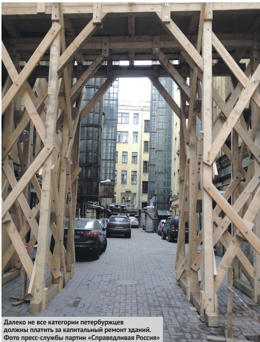
Далеко не все категории петербуржцев должны платить за капитальный ремонт зданий.

Или же деньги сертификата потратить на погашение ипотеки. Эту инициативу в парламенте не поддержали. Через неделю аналогичный проект закона внесли единокороссы, сумму выплаты при этом сократили втрое. Большинство на этот раз проголосовало иначе, поддержав инициативу единокороссов, на самом деле эсеров. Сейчас в очереди на обязательное предоставление земельного участка в городе стоит более 26 тысяч многодетных семей.