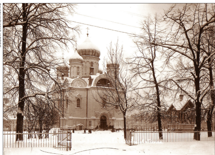
Собор Святой Екатерины в Царском Селе. 20-е годы XX века. Одна из немногих сохранившихся фотографий храма, взорванного в 1939 году

Воссоздание взорванного в 1939 году Екатерининского собора в первоначальном виде, сказано в обращении владыки, будет той жемчужиной, которая не только завер-