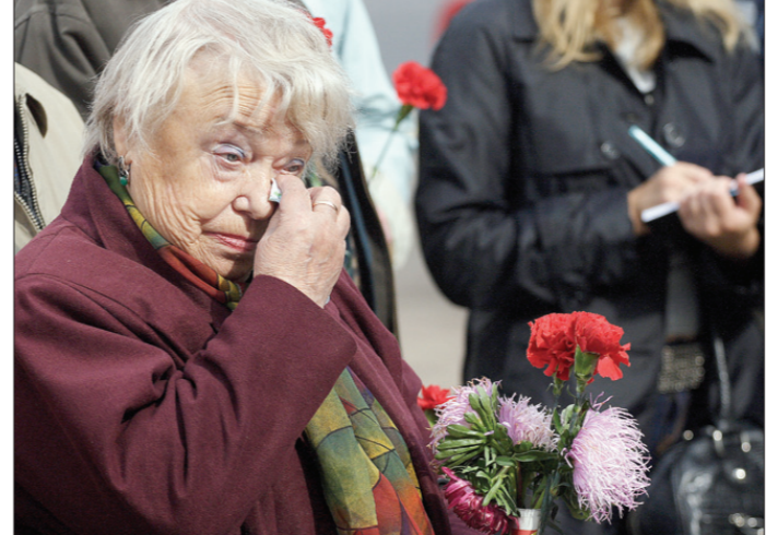
И время не способно залечить раны в сердцах тех, кто пережил блокаду...