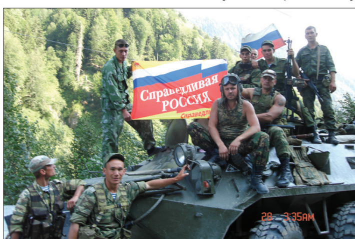
Август 2008-го. Колонна российских миротворцев, встреченная А. Панферовым во время выполнения им гуманитарной миссии в Южной Осетии

— А за что вы получили свою медаль «За отвагу»? Ведь вы