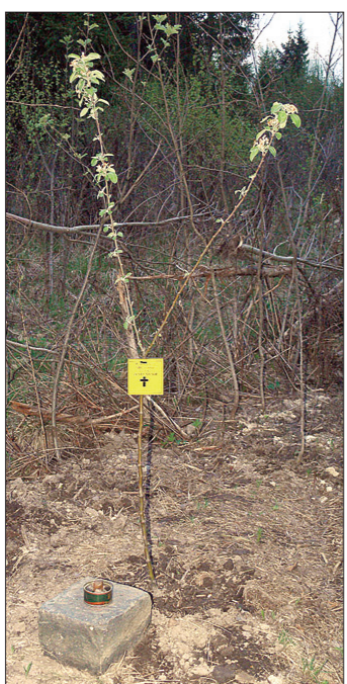
Мемориальное деревце, выращенное из клетки, в которую была вживлена человеческая ДНК

Даже школьникам известно, что ВСЯ информация о ВСЕХ признаках не только животных, но и человека хранится в молекулах удивительно по своим свойствам биополимера — ДНК. Это утверждение — центральная догма современной (официальной) науки о наследственности живых форм. Упомянутый вывод науки послужил основой весьма экстравагантного проекта сохранения наследственности смертельно больных или уже умерших людей, получившего название «Биоприсутствие». В его основе — вживление молекул человеческой ДНК в клетки многолетних растений.