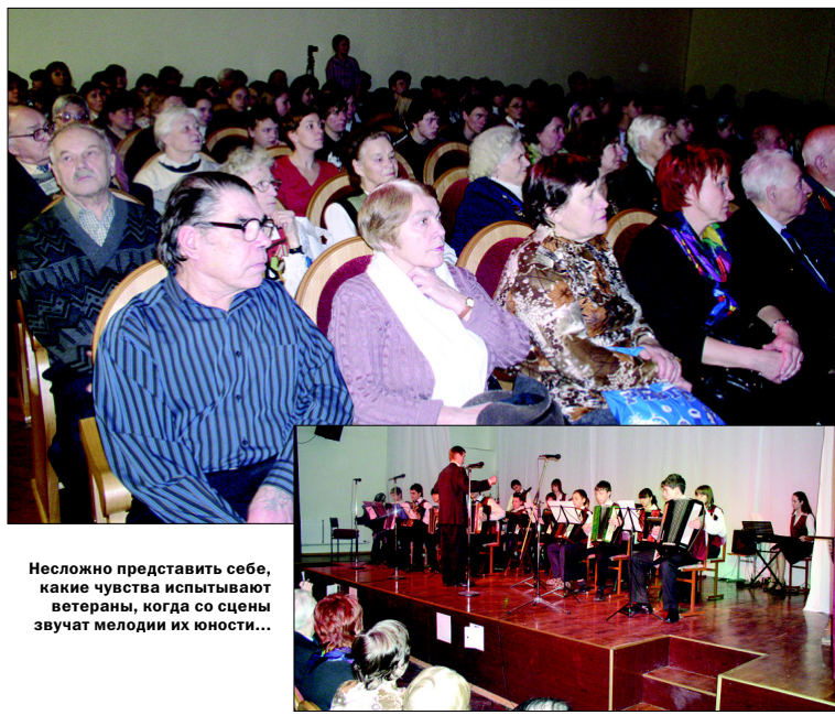
Несложно представить себе, какие чувства испытывают ветераны, когда со сцены звучат мелодии их юности...

Регулировщица, военфельдшер, шофер, речник, моряк... Ими ныне седовласые мальчики и девочки сороковых стали в блокаду, когда через Красногвардейский район города, окруженного отборными гитлеровскими армиями, пролегла Дорога жизни. Праздничная дата — 65-я годовщина полного освобождения Ленинграда от фашистской блокады — собралась в небольшой зал свыше двухсот человек. Им было о чем поговорить друг с другом.