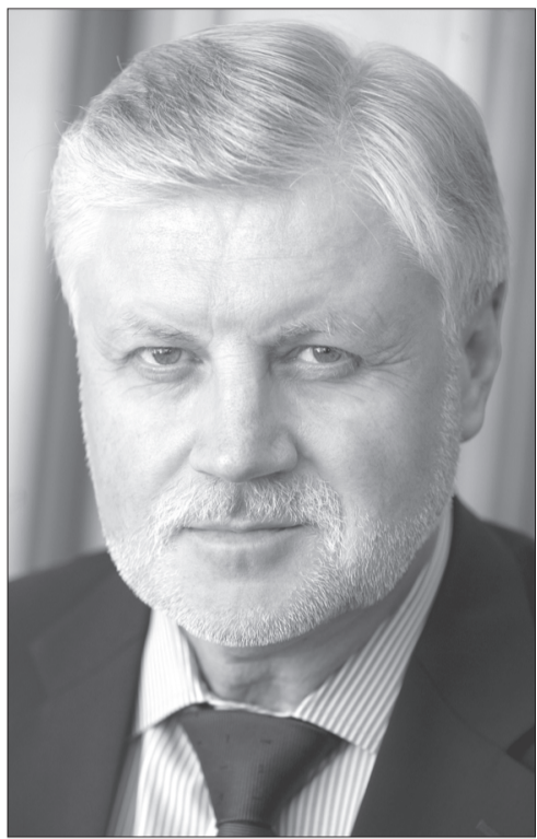
Спикер Совета Федерации, Председатель партии СПРАВЕДЛИВАЯ РОССИЯ Сергей Миронов

Считаю неприемлемыми и опасными попытки решать с позиций финансовой экономии вопросы, которые затрагивают жизненные интересы всего населения России. На примере памятных монетизации льгот, реформы ЖКХ мы не раз могли убедиться, к каким негативным послед-