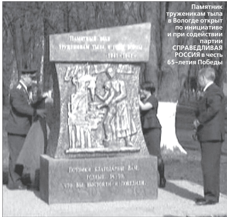
Памятник труженикам тыла в Вологде открыт по инициативе и при содействии партии СПРАВЕДЛИВАЯ РОССИЯ в честь 65-летия Победы

А на каких весах взвесить и оценить поступок пионеров, отдавших свои детские денежные