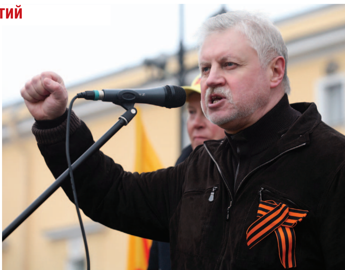
Сергей Миронов на митинге 1 мая

3 мая в адрес Сергея Миронова направлено уведомление о досрочном прекращении его полномочий члена Совета Федерации.