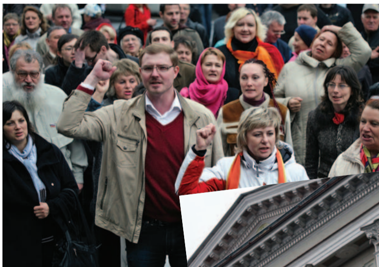
18 мая в день отставки Сергея Миронова перед зданием ЗАКСа

Здание плотным кольцом окружили ОМОН и полиция. Звучали лозунги «Наш сенатор – Сергей Миронов!».