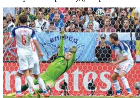
Победный для бельгийцев гол в ворота России

За три игры на Чемпионате мира в Бразилии сборная России забила всего два гола. Меньше голов забили только команды Гондураса, Камеруна и Ирана (по одному голу за три матча).