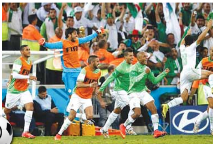
Сборная Алжира празднует выход в плей-офф ЧМ. На их месте должны были быть наши футболисты, но...