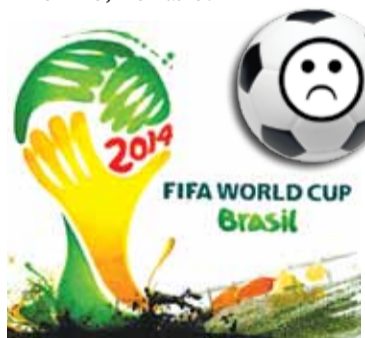
Еще один неудачный чемпионат Мира для сборной России

Ольга СЛАСТУХИНА, по материалам «Справедливой газеты»