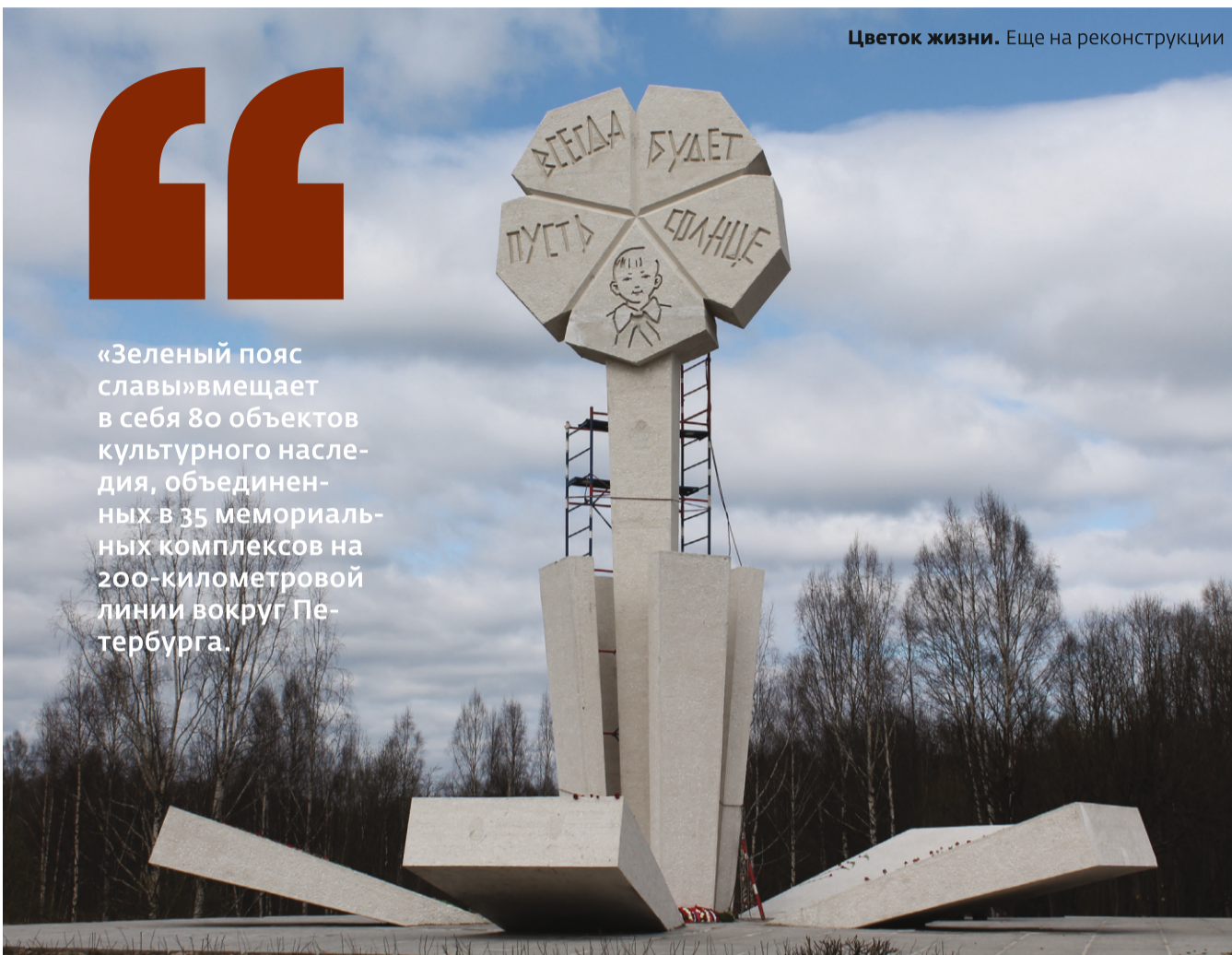
Цветок жизни. Еще на реконструкции

А сейчас привозишь детей на тот же Невский пятачок, а они видят там, в легендарной зоне прорыва блокады, каски, кости не захороненных солдат, вымытые дождями и невиской водой. И тут же в десяти минутах езды на машине, находится деревня Сологубовка. Там в 2000 году было торжественно открыто немецкое военное кладбище, где похоронены 80 тысяч солдат вермахта. И там все в идеальном порядке. В Великом Новгороде, в прибалтийских республиках подобная ситуация: рядом с советскими кладбищами немецкие, и везде такой же контраст. Поэтому вместо разговоров о патриотизме надо заниматься самым простым и самым святым делом хоронить наших солдат и достойно увековечивать их память и подвиг. Я имею право говорить это как человек, потерявший отца в сентябре 1941 году и до сих пор его не нашедший, и маму, которая умерла в