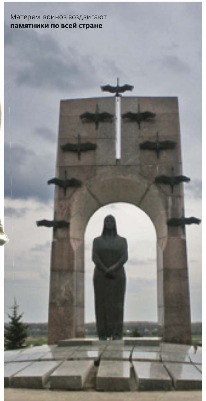
Матерям воинов воздвигают памятники по всей стране

который погиб в январе 1945 года, пришла уже в пустой дом, в который израненные летом 45-го вернулись трое сыновей. От полученных на фронте ран они в скором времени ушли из жизни. В настоящее время в Алексеевке функционирует дом-музей семьи Володичкиных.