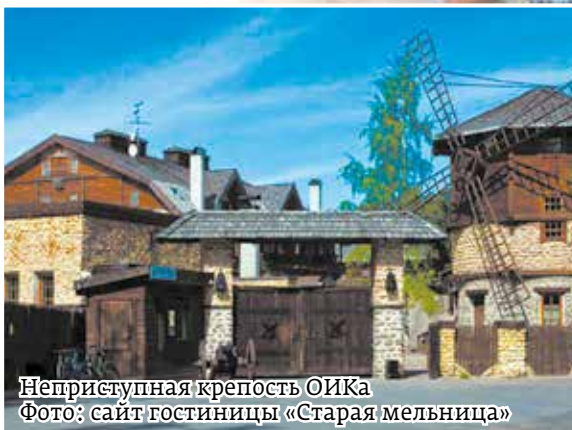
Неприступная крепость ОИКа

видимо, будут форты Кронштадта», – комментировал ситуацию депутат.