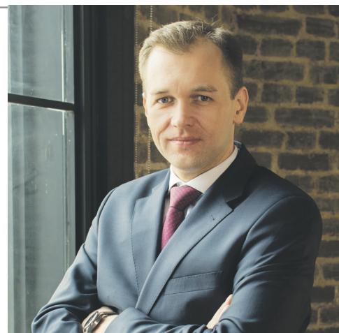
Дмитрий Ушаков, депутат Государственной Думы, член Комитета по бюджету и налогам, кандидат экономических наук

Важно Развитие промышленности не приведет к взрывному росту рабочих мест – современная промышленность автоматизирована и роботизирована, высококвалифицированная рабочая сила – да, инвестиции для увеличения производительности труда – да, массовое создание рабочих мест – невозможно. Ввиду этого необходимо создать условия для четких сигналов государства: малое предпринимательство – это хорошо, это престижно, и это поддерживается на уровне государственной политики. Именно поэтому необходимо ввести принцип фиксации неизменных условий налогообложения в первые пять лет ведения экономической деятельности.